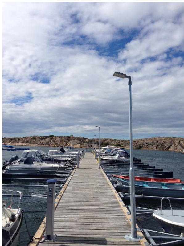
Sotenäs kommun – Installerad 2014