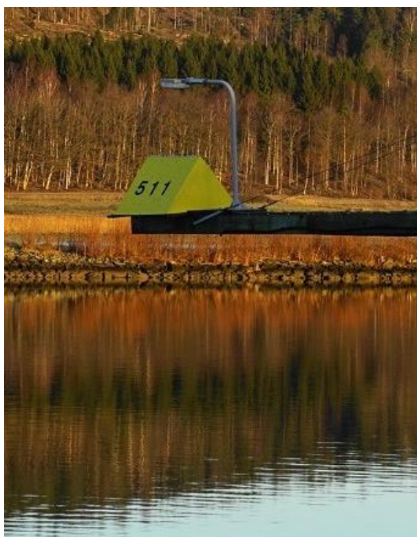
Göta älv Sjöfartsverket – Installerad 2016