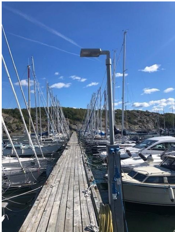
Göteborgs stad Grefab – Installerad 2018