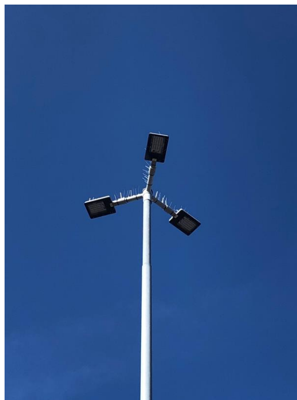
Öckerö Hamn – Installerad 2019