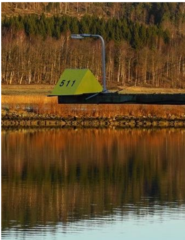
Göta älv Sjöfartsverket – Installerad 2016