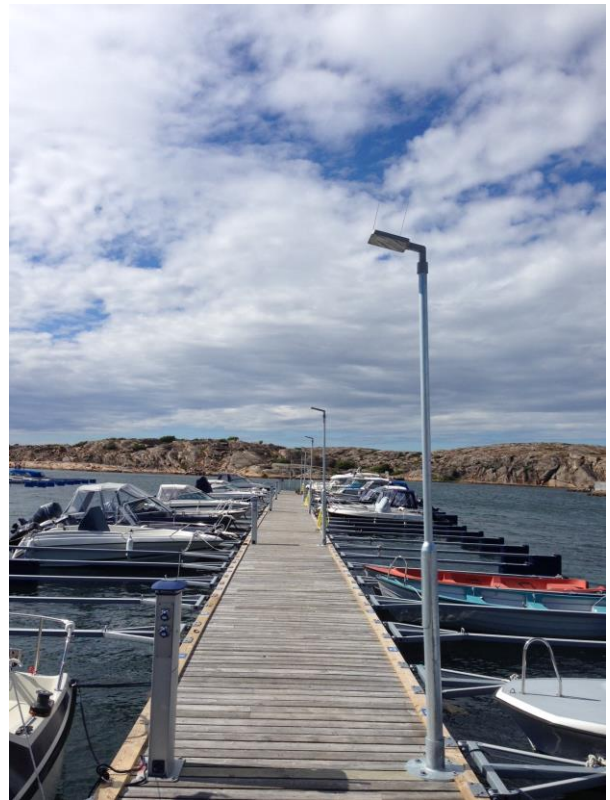
Sotenäs kommun – Installerad 2014