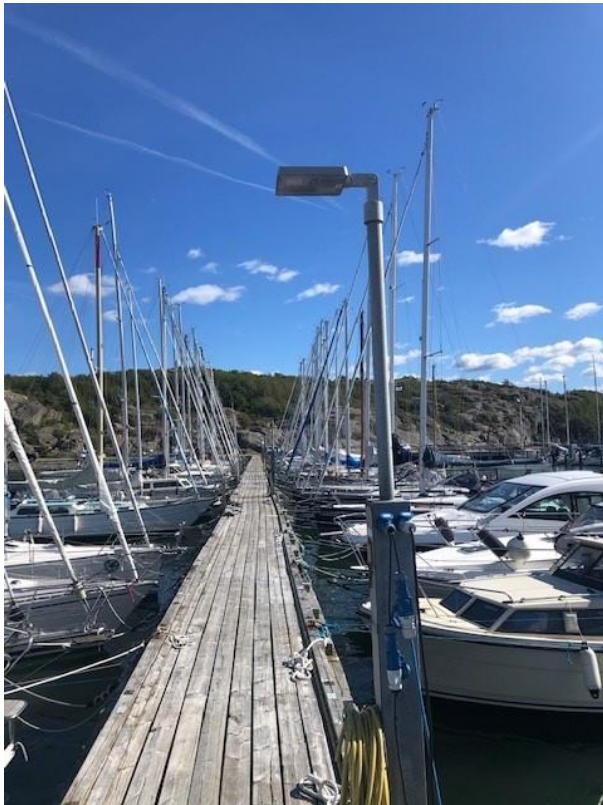
Göteborgs stad Grefab – Installerad 2018