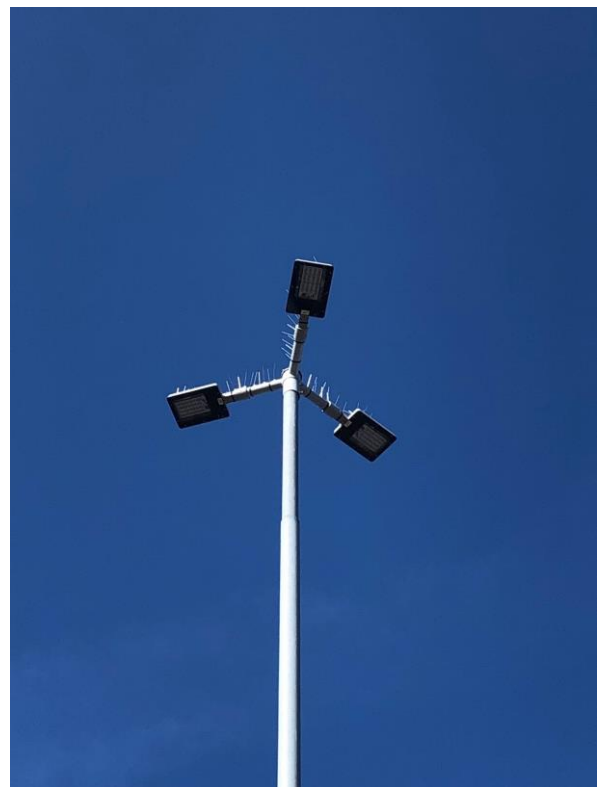
Öckerö Hamn – Installerad 2019