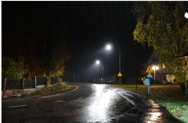
Exempel lokalgata 7m stolpe Basic 4200 lumen 24W