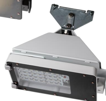
Vit RAL 9003