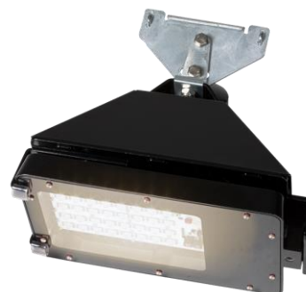
Svart RAL 9005