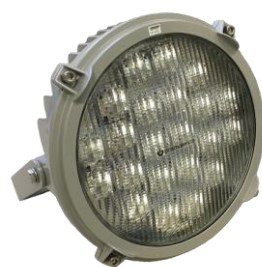
Stella 120-300W DALI