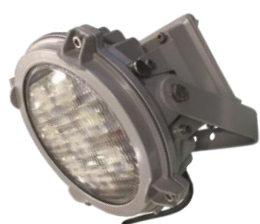
Stella Mini 110W DALI

Alla IQ armaturer/styrenheter kan enkelt via en Gateway kopplas upp till Internet plattformen ActiveLights Connect IoT. En Gateway monteras i anläggningen och blir länken mellan det lokala radiosystemet och ActiveLights Connect IoT på Internet.